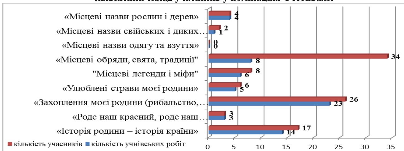
Розподіл учнівських робіт за номінаціями, кількісний склад учасників у номінаціях Фестивалю

Попри те що Фестиваль відбувався в області вперше, учні закладів загальної середньої освіти взяли досить активну участь у заході. Відзначимо, що найактивнішими були учні закладів освіти Нікольського району (17 робіт), Черкаської селищної ради (10 робіт).